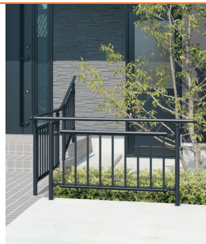
ブラック／埋め込み支柱／たて格子パネル取り付け仕様