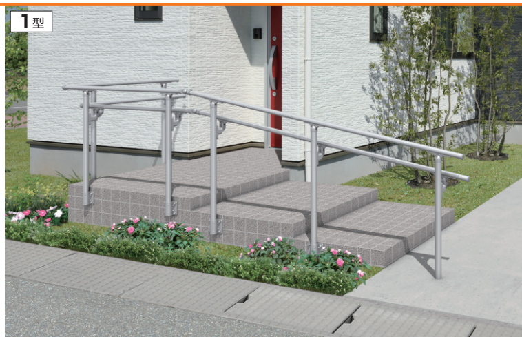
サンシルバー／ベースプレート支柱(側面タイプ)＋埋め込み支柱／2段笠木仕様