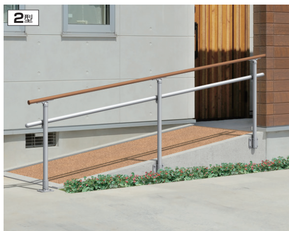
オレンジチェリー・サンシルバー／ベースプレート支柱(上面＋側面タイプ)／横バー取り付け仕様