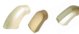
エンドブラケット