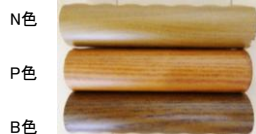
ストレート用手摺